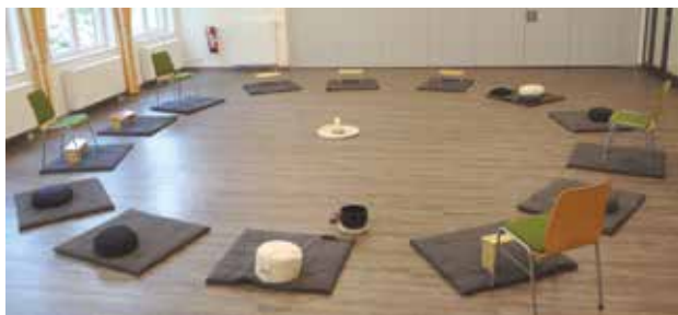
St. Josef Saal im Katholischem Gemeindeheim St. Josef, Essen-Kupferdreh

2. Freitag, 04.09.2020 , 18.00 - 21.00 Uhr und Fortsetzung Samstag, 05.09.2020 , 9.30 - 12.30 Uhr