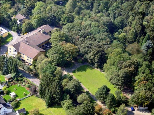
Haus am Turm

im Haus am Turm, Essen Werden, Am Turm 7