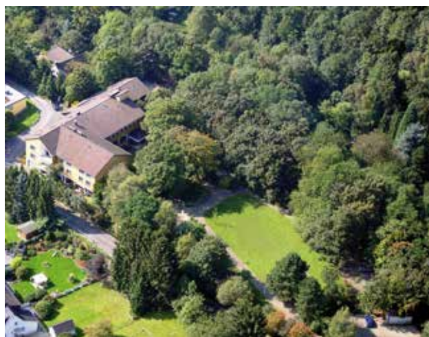
Haus am Turm

Mit der S-Bahn 6 Essen Hbf. – Düsseldorf- Hbf. bis Essen – Werden S Bahnhof , dann Kleinbuslinien 182 oder 192 bis Haltestelle Am Turm