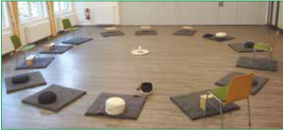
St. Josef Saal im Kath. Gemeindeheim Kupferdreh