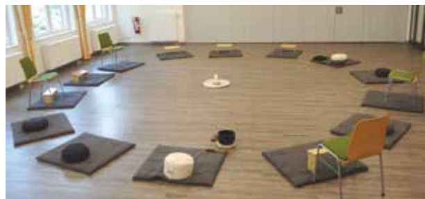
St. Josef Saal im Katholisches Gemeindeheim