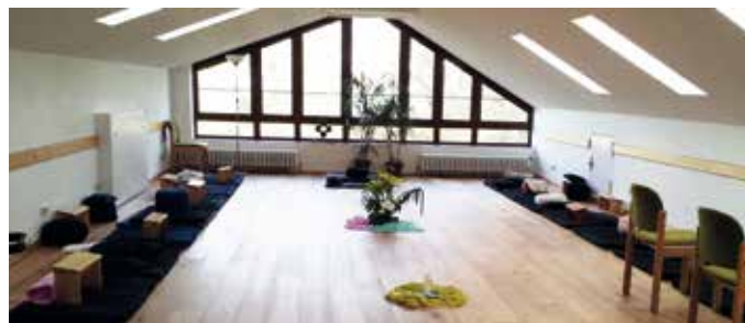
Meditationsraum im Haus am Turm

Zuschuss möglich aus Spendenmitteln bei den Zimmern ohne Dusche und WC auf dem Zimmer