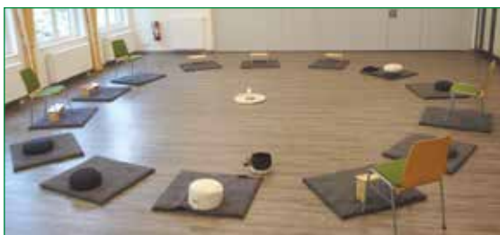
St. Josef Saal im Kath. Gemeindeheim Kupferdreh