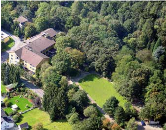
Haus am Turm

Mit der S-Bahn 6 Essen Hbf. – Düsseldorf- Hbf. bis Essen - Werden S Bahnhof , dann Buslinie 182 + 192 bis Haltestelle Am Turm